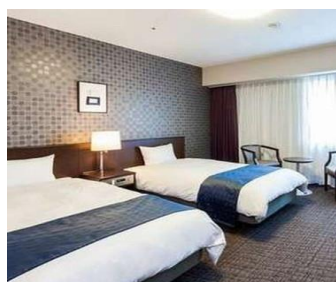
ご利用客室（ツイン）